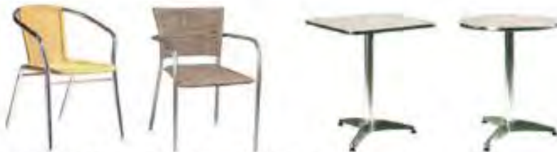
Möblierung in den Materialien Rattan / Kunststoff und Aluminium