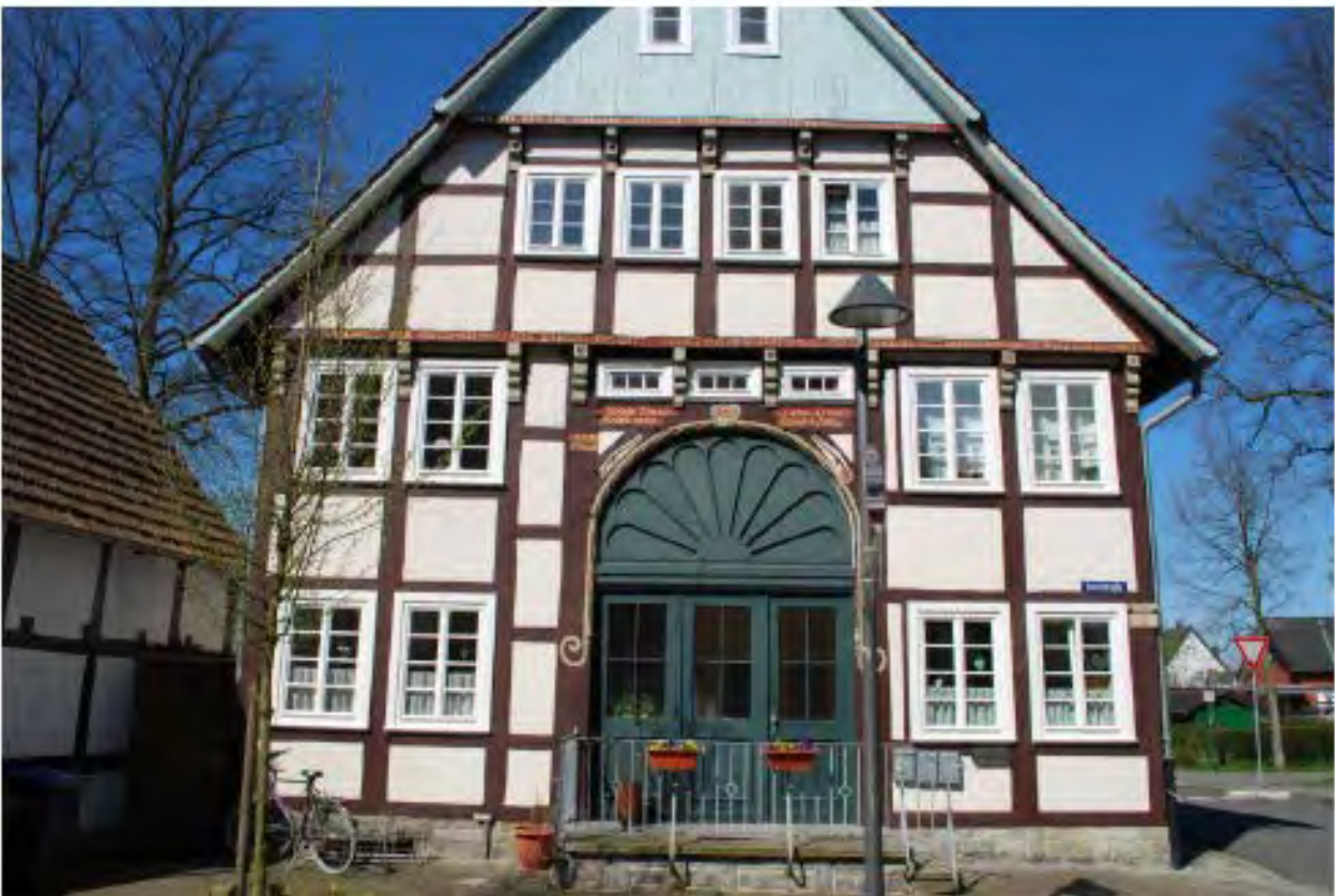
Stadtgrundriss und herausragende Gebäude fügen sich zu einem harmonischen Ganzen zusammen.