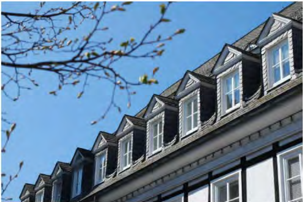
Dachaufbauten ordnen sich der Dachlandschaft unter und sind auf die Fassade abgestimmt.