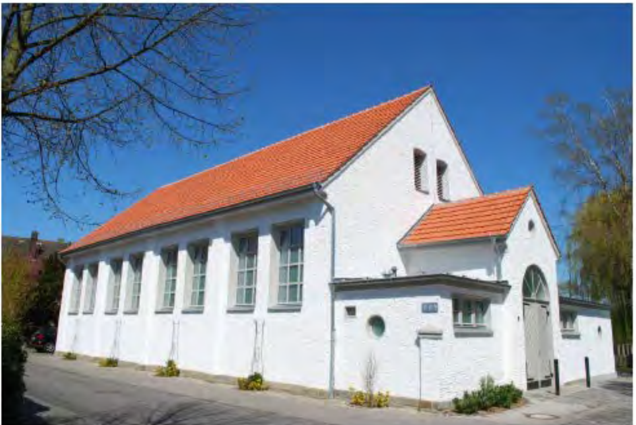
Energetische Sanierungen nehmen auf das Wesen und die Gestaltung der Gebäude Rücksicht.