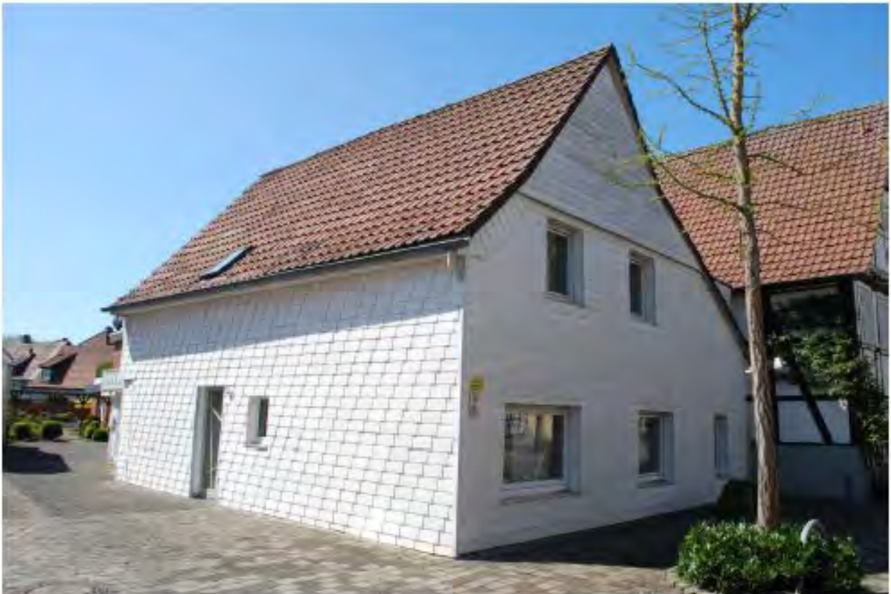
Fassadenmaterial und Farben passen zum Wesen und zur Entstehungszeit des Gebäudes. Unpassende Fassadenverkleidungen stören das Erscheinungsbild und nehmen dem Gebäude seine Lebendigkeit.