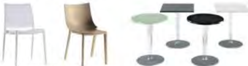
Möblierung in den Materialien Kunststoff und Aluminium

Die Materialien für Gastronomiemöblierung werden auf einen qualitätvollen Kanon beschränkt (Beispiel aus Bad Salzuflen).