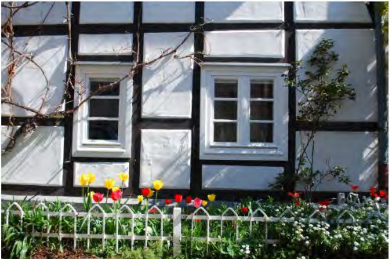
Private Vorzonen sind gärtnerisch gestaltet und – wo gewünscht – stadtbildtypisch eingefasst.