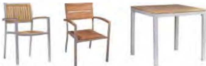
Möblierung in den Materialien Holz und Aluminium