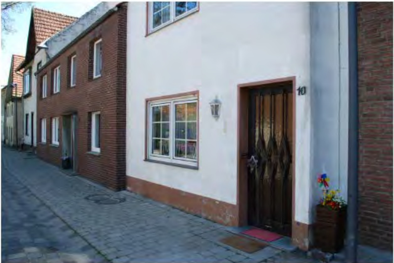
Fassadenöffnungen. Gut gestaltete Fassadenöffnungen wie Fenster und Haustüren passen zum Gebäude und seiner Entstehungszeit. Mit untypischen Materialien wirken sie schnell als Fremdkörper.