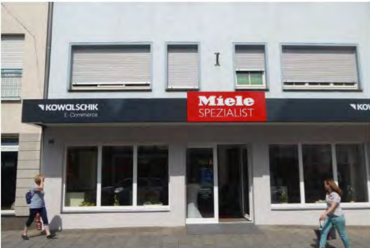
Vordächer und Markisen ordnen sich der Fassade unter und stören deren flächiges Erscheinungsbild nicht.