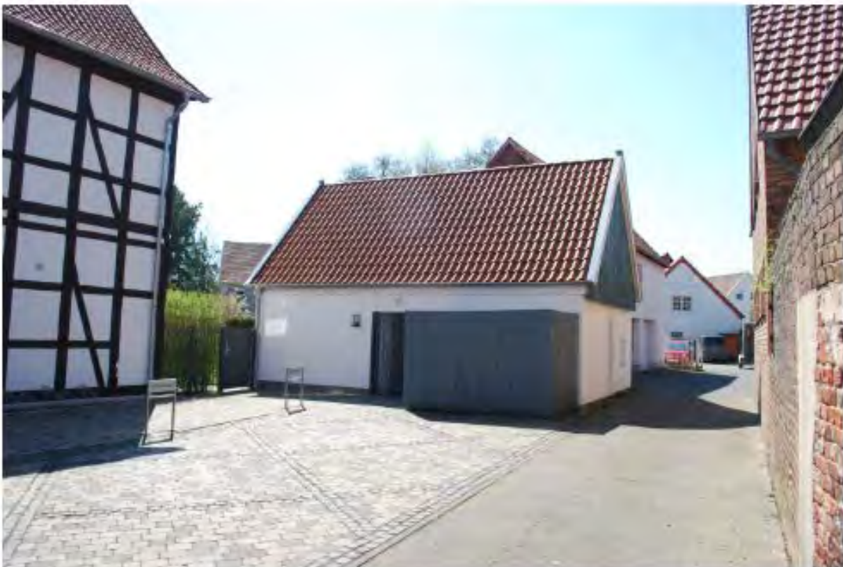
Geschosse und Gebäudehöhen orientieren sich an der Umgebung. Auch Nebengebäude passen sich in Form, Farbe, und Material ein.