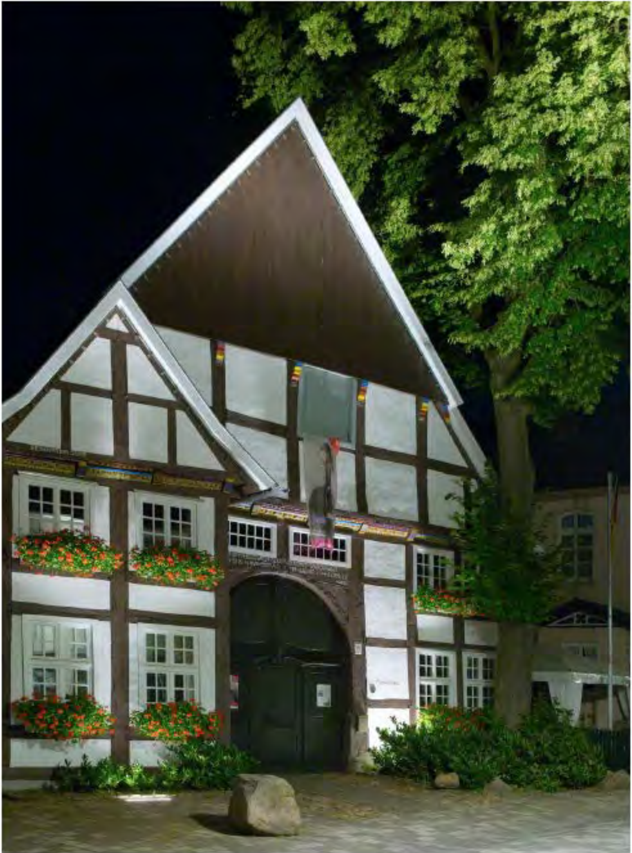
Objektbeleuchtung. Eine gute Beleuchtung unterstreicht den Charakter des Gebäudes und ist weder grell noch aufdringlich.