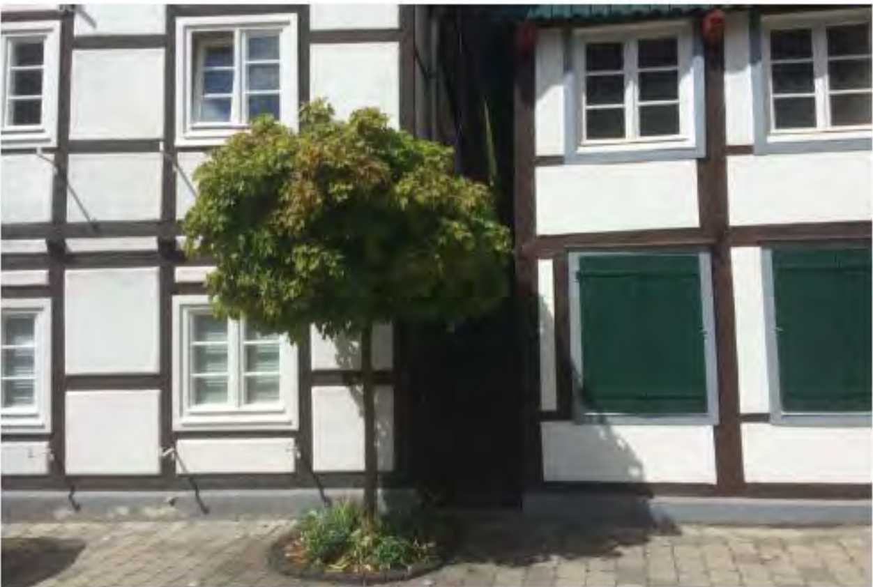
Die typischen Gebäudestellungen bleiben bestehen. Brandgassen werden erhalten und, wo möglich, als öffentlicher Durchgang genutzt.