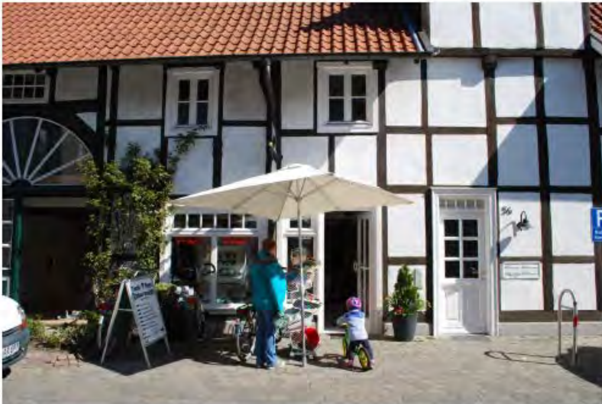
Werbung vor dem Gebäude ist zurückhaltend gestaltet und bleibt auf bestimmte Bereiche begrenzt.