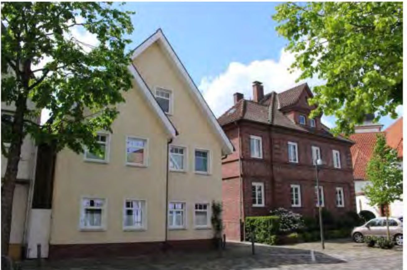
Beispiele für eine gut gestaltete Erneuerung und einen sich einfügenden Neubau.