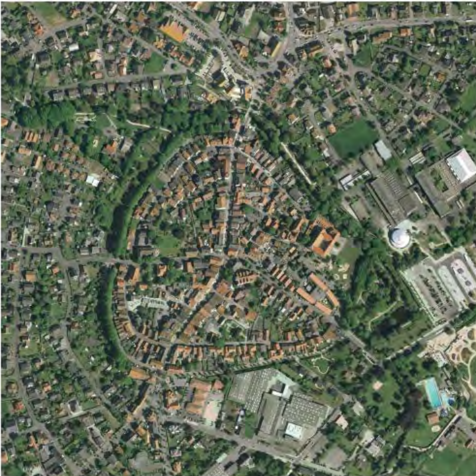
Rote Steildächer mit zurückhaltenden Aufbauten bestimmen auch weiterhin die Dachlandschaft in der Innenstadt von Rietberg.

Neben – in der Innenstadt von Rietberg noch vorhandenen, das Erscheinungsbild aber wenig störenden – Antennen könnten besonders die Satellitenanlagen ein gestalterisches Problem darstellen. Ihre Anbringung ist nur auf dem Dach möglich – mit einer Gestaltung und Farbwahl, die sich dem Gebäude und der Dachlandschaft unterordnen. Vom öffentlichen Raum dürfen sie nicht einsehbar sein.