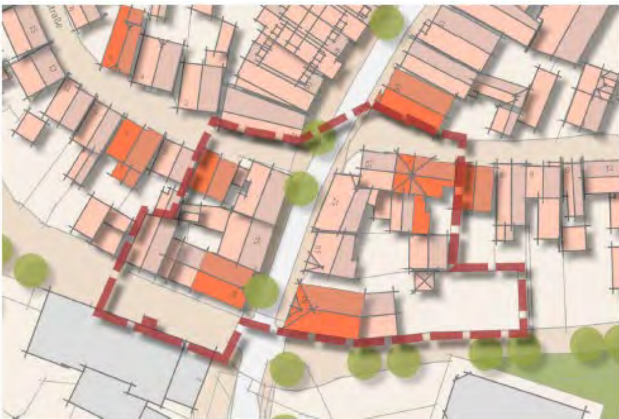
Geltungsbereich des Bebauungsplanes Nr. 9

Auch dies wollen die Gestaltungshinweise zeigen.